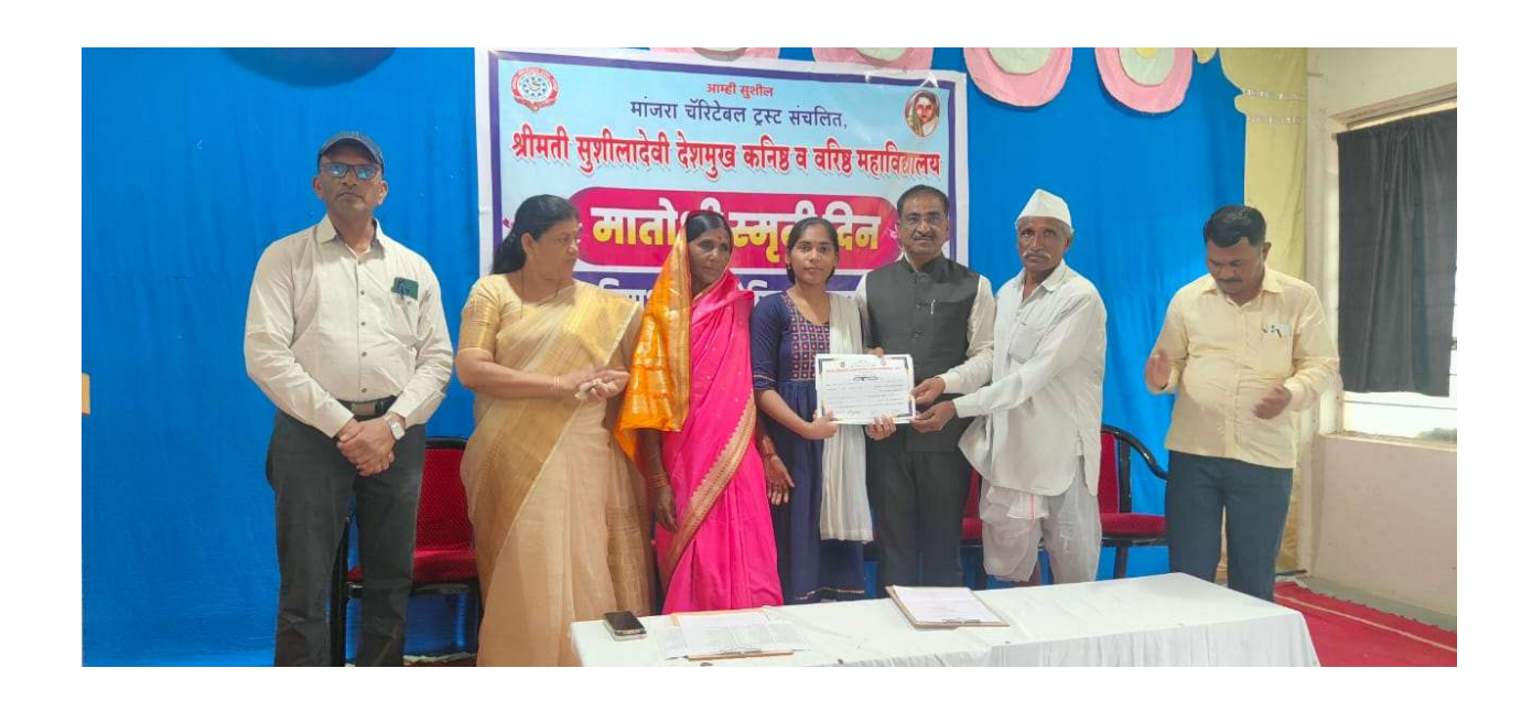
Students with parents receiving the prizes