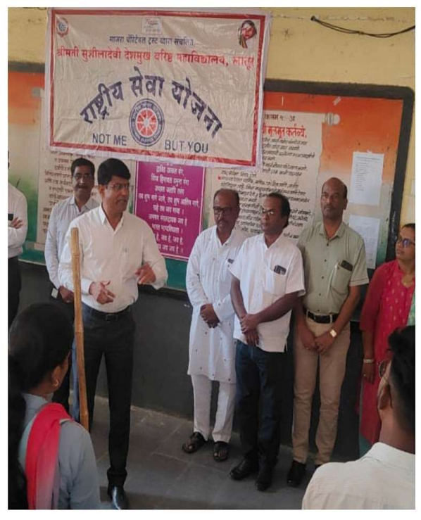
Swachhatadut ready for Swachhata Utsav. Inauguration Ceremony