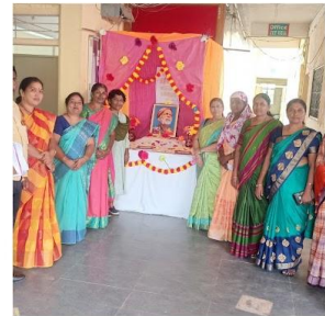
Local Poets reciting the poems in 'Kavisammelan'