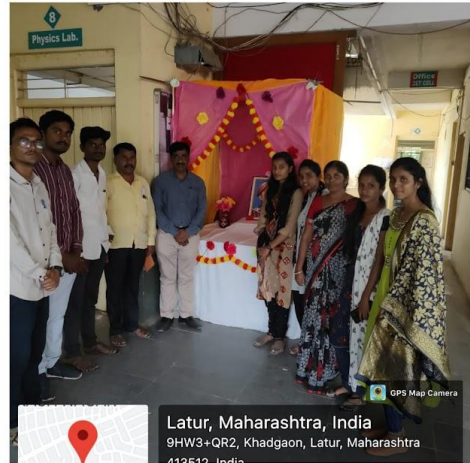
Hon. Arun Dhaigude Delivering a lecture on 'Vidya Vinayen Shobhate'