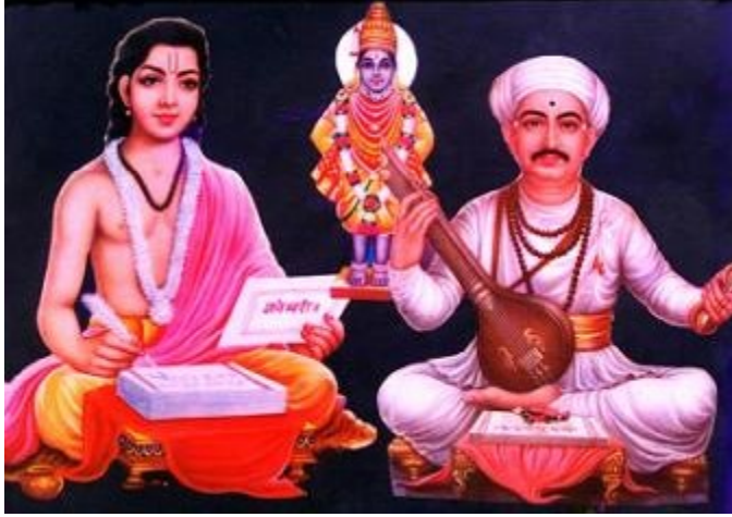
संत ज्ञानदेव, संत तुकाराम